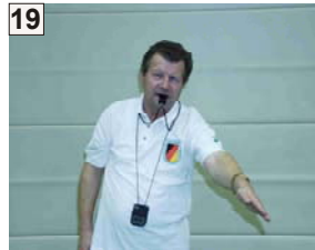
19 Übergetreten und Anzeige des Treffers