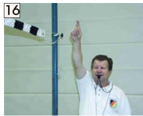
16 Deckenberührung (Halle) und Anzeige des Treffers