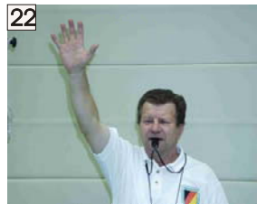
22 Zeitspiel (5 Sekunden) und Anzeige des Treffers