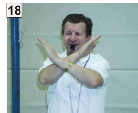
18 Spielende oder Halbzeit