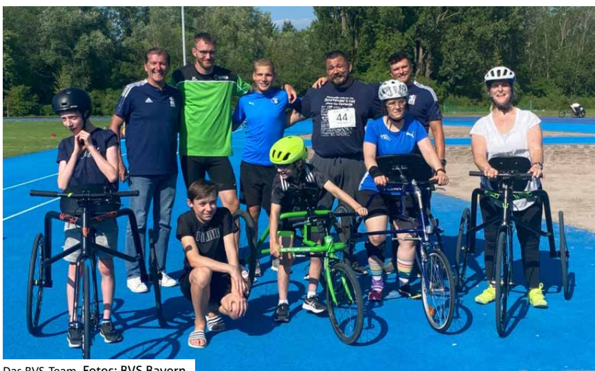
Das BVS-Team.