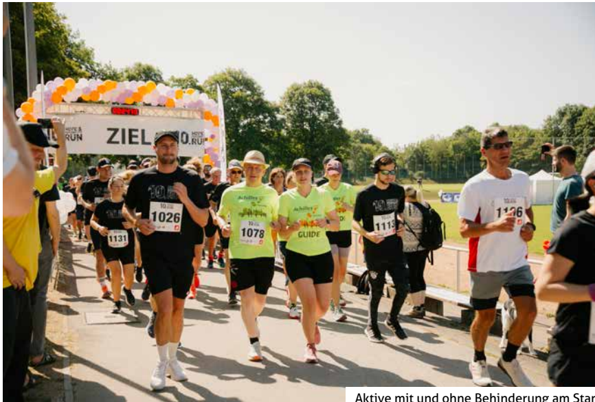
Aktive mit und ohne Behinderung am Start

Und für die meisten steht schon jetzt fest: 2024 bin ich wieder dabei!